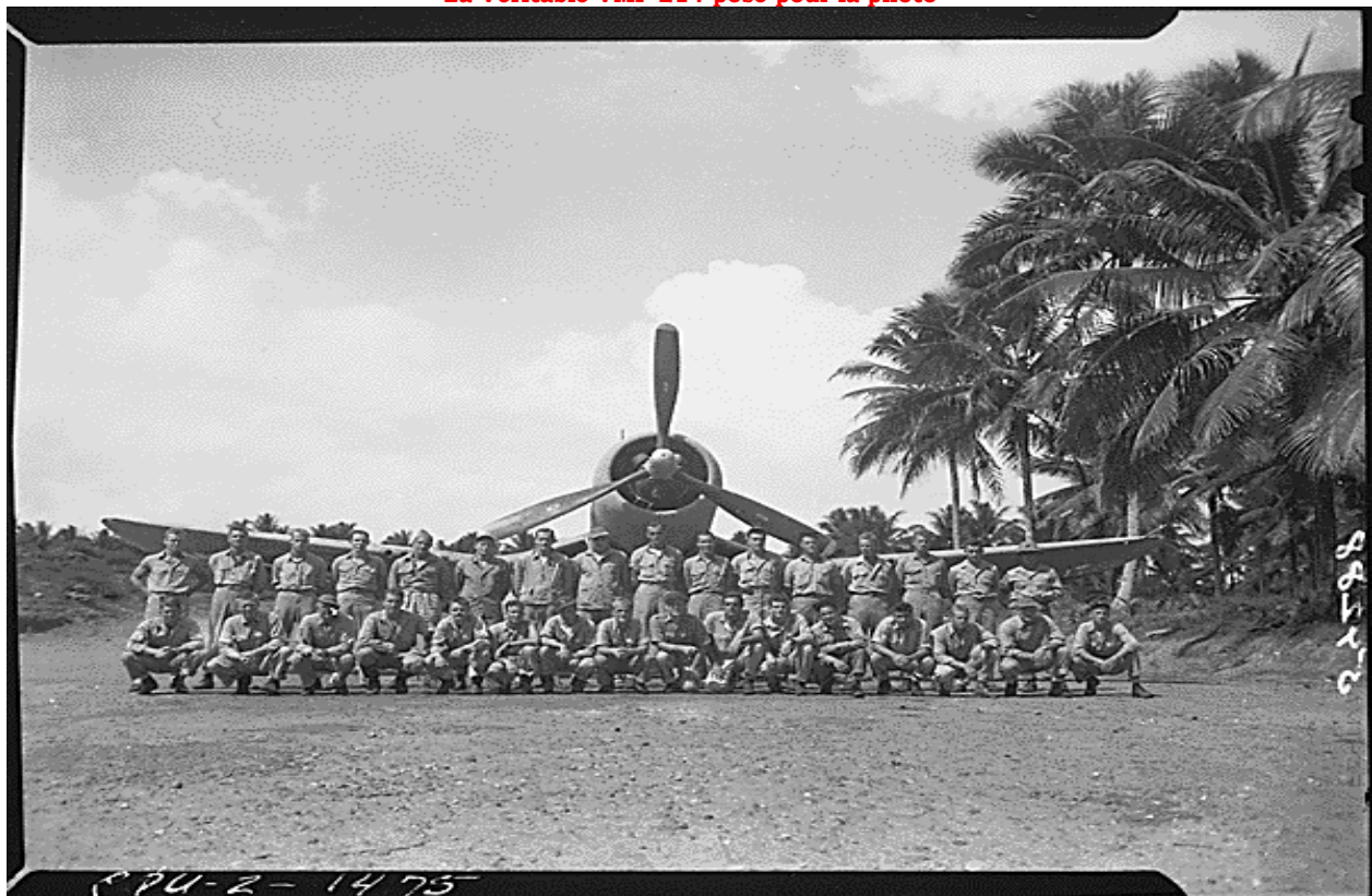
- La Véritable VMF 214 pose pour la photo -

Quelques véhicules de chantier, camions GMC, Jeep non armés et autres BULLDOZER peuvent être garés ça et là aux alentours de la piste sur la plage !